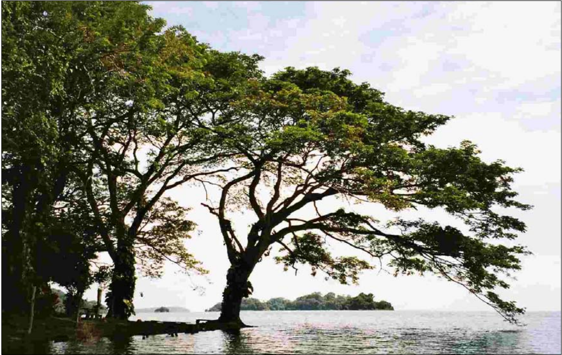
니카라과 호수에 위치한 솔렌티나메 섬의 풍경

두워도 니카라과 민중은 눈이 아리게 맑은 세상을 꿈꾸고 있었다. 우리는 이런 세상이 불가능하다고 알고 있기에, 그런 꿈을 아직도 가슴에 간직하고 사는 사람을 순박하게 여긴다. 그리고 이런 그림을 원시주의(Primitivism)라고 부른다.