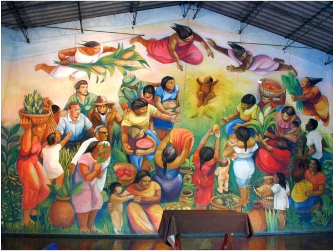
마나과 소재의 '바타올라 노르테 문화센터' 벽화