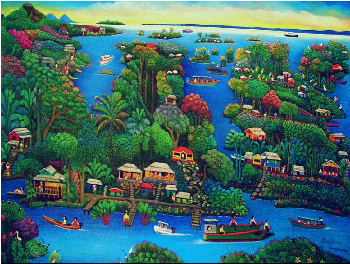
로돌포 아레야노, 〈작은 섬〉

솔렌티나메 섬에 도착했다. 카르데날이 신앙공동체 사람들에게 가져온 물건을 꺼내주고 있는 동안 주변을 둘러보던 코르타사르의 눈에 띄는 것이 있었다. 바로 구석지에 세워놓은 그림들이었다.