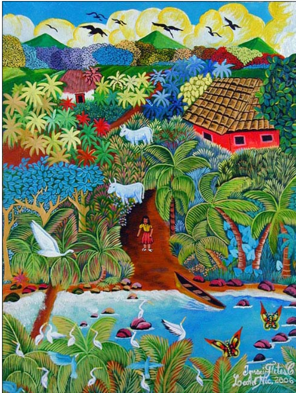
호세 이그나시오 플레테스, <농장>