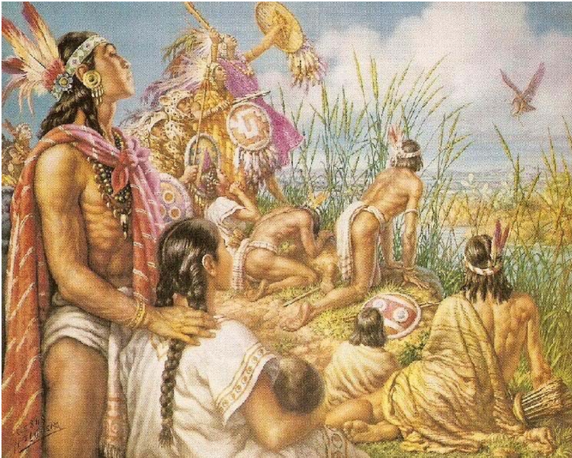
뱀을 찾아 먹는 독수리를 발견한 메시카 족

년은 지난 시점이다. 그러한 일이 곧 도시와 국가의 기원이 되었다. AD 1300년이면 이집트의 피라미드가 폐허로 방치된 지 3천 년이 지나고, 중국인이 거대한 제국에 성을 쌓고 아테네나 로마나 공히 수차레에 걸쳐 건설되고 파괴된 지 오래되고, 베네치아가 바다의 맹주로 군림하던 시절이었다. 또 1300년이면 유럽 남부 전체에 르네상스의 바람이 불던 시기였다. 그런데 우리 역사의 주축으로 삼아온 아메리카 주민들, 즉 아스테카 인들은, 1만 2천 년 전 중국인들이 그랬듯이, 여전히 수렵인-채집인이었다. 아스테카를 근간으로 국민 정체성을 형성하려고 하기에 1만 2천년은 적지 않은 뒤처짐이다.