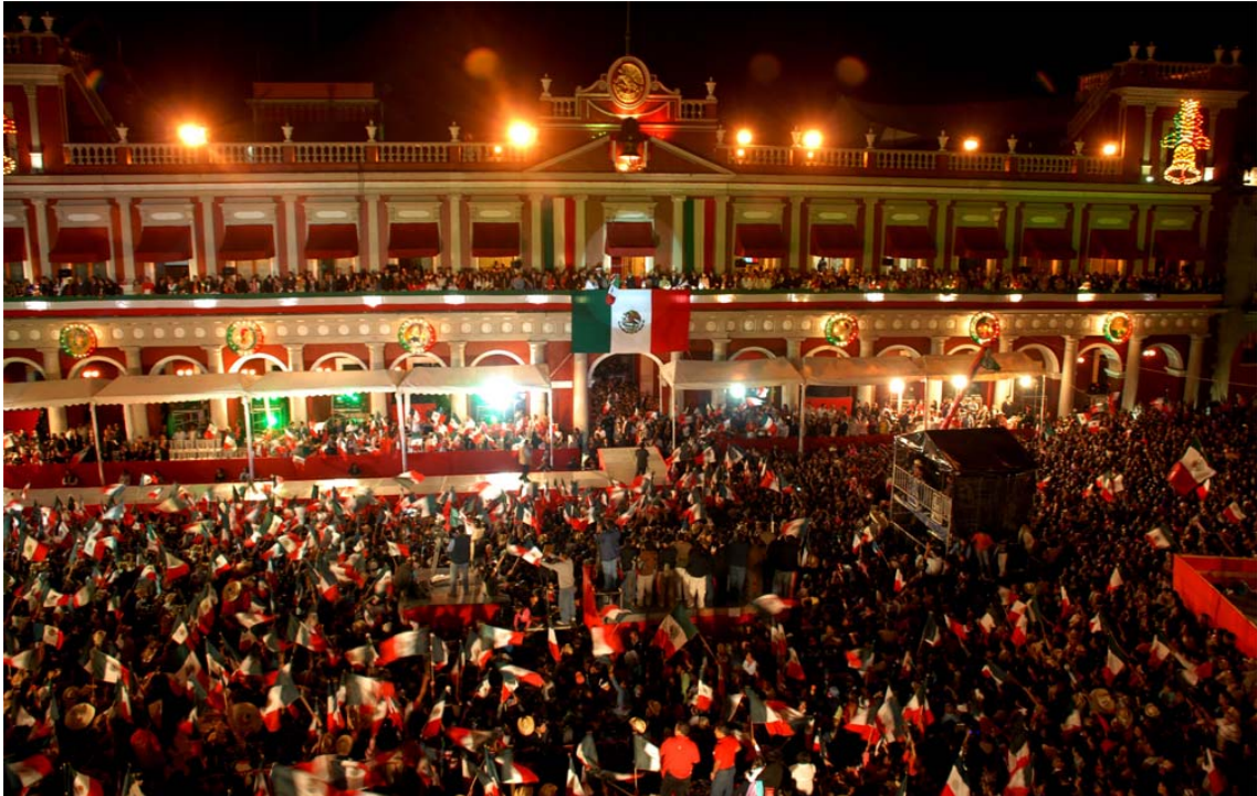
독립의 외침 (9월 15일 밤 멕시코 소칼로 광장)

려야 한다는 계율도 지킬 겸, 귀가 길에 시장에 들러 물건도 사고 팔 겸해서 인근에서 왔다. 일단 교회 마당이 가득 차자, 신부는 일꾼들에게 가서 몽둥이나 낫이나 되는 대로 구해오라고 했다. 혼란은 그렇게 시작되어서 고작 10개월 남짓 이어졌을 뿐이고, 케레타로, 과달라하라, 멕시코시티 근교로 이루어지는 소규모 삼각지대 너머로까지 확대되지도 않았다. 하지만 결국 이달고는 독립주의자들과 공감하지 못한 채 소외되고 말았다. 그 이유는 투쟁에 참여하지 않은 사람들에게 이달고가 저지른 범죄와 지나친 강탈 때문이었다.