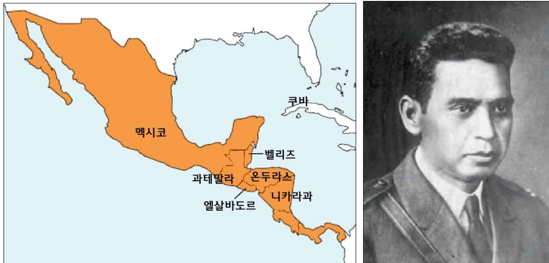
엘살바도르의 독재자 막시밀리아노 에르난데스 마르티네스(오른쪽 사진)