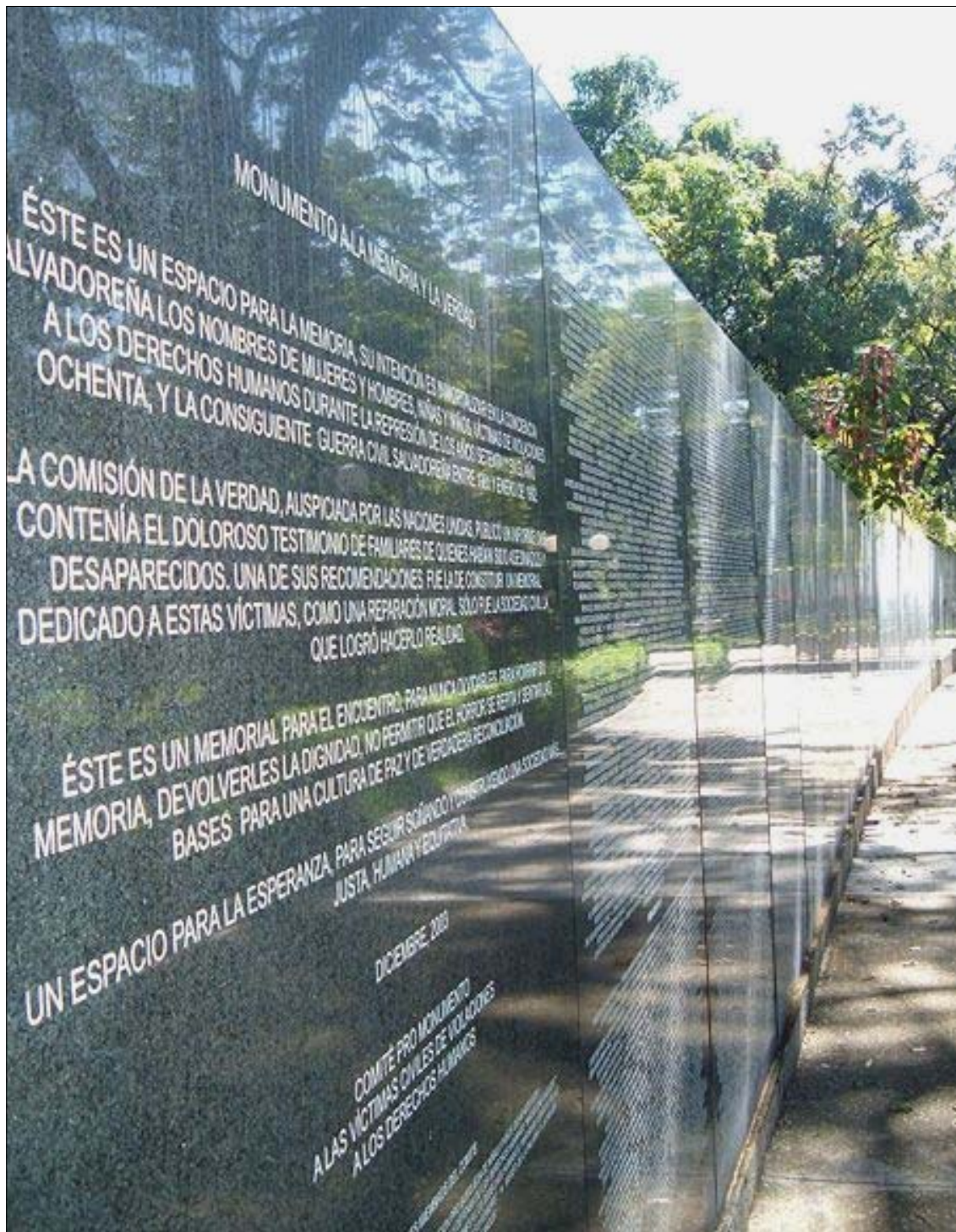
1980년 3월 24일 로메로 대주교의 피살은 50년에 걸친 엘살바도르 군부독재의 필연적인 결과요, 그 후 13년(1980~1992)에 걸쳐 약 7만 5천 명의 희생자와 7천 명의 실종자를 양산한 내전의 시발점이었다. 사진은 엘살바도르의 수도 산살바도르에 세워진 ‘기억과 진실을 위한 기념비’. 내전 기간에 희생된 사람들의 성명을 새겨 넣었다.