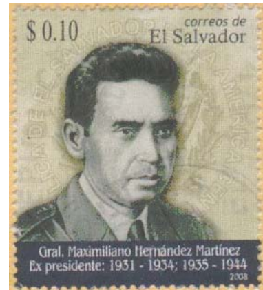
2008년에 발행된 막시밀리아노 에르난데스 마르티네스 기념우표