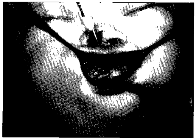
Fig. 2. Oral examination shows left side syngnathia and the opening between upper and lower gingiva were limited to 10mm on the right side

소아과와 이비인후과에서 동반기형을 확인하기 위하여 시행한 이학적 검사에서 좌측 상악과 하악의 완전한 유착과 10 mm