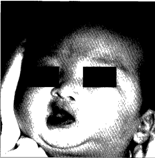
Fig. 1. Frontal photograph Note microstomia, blue sclera and low set ears