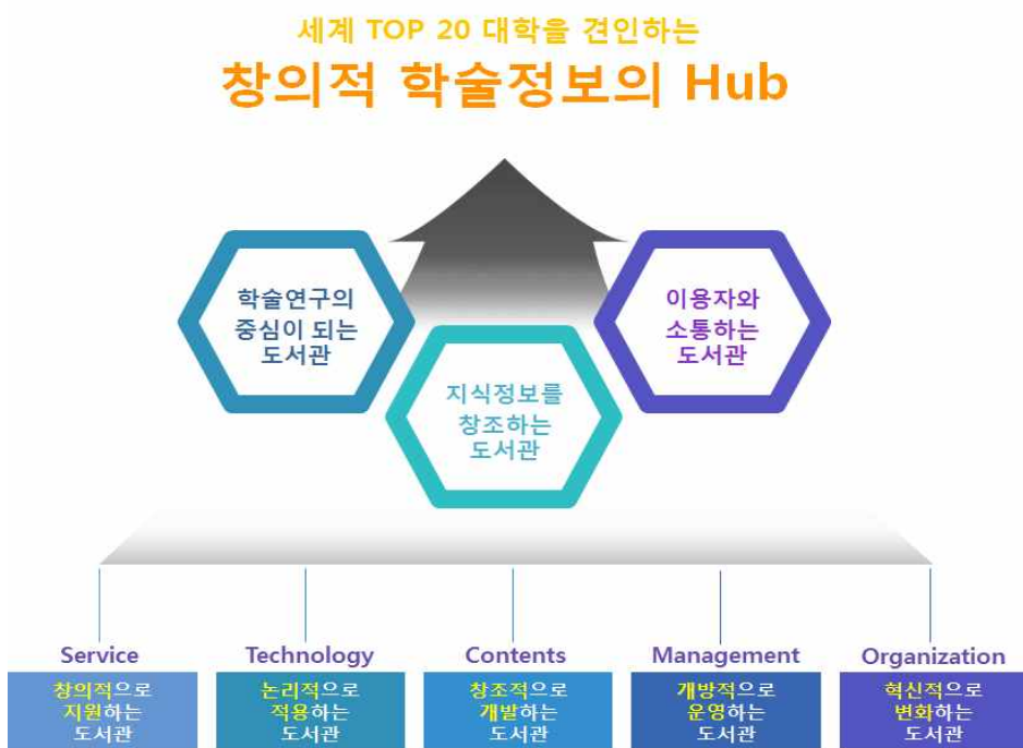
< 서울대학교 중앙도서관 비전 및 핵심 가치 >

중앙도서관의 비전은 모기관인 서울대학교가 대학운영계획에서 목표로 제시한 세계 20위 대학 진입을 승계하여 ‘세계 Top 20 대학을 견인하는 창의적 학술정보의 Hub’ 로 하였다. 비전을 실천하기 위한 핵심 가치로 ‘학술연구의 중심이 되는 도서관’, ‘지식정보를 창조하는 도서관’, ‘이용자와 소통하는 도서관’ 으로 세 가지를 제시하였다. 중점적으로 추진할 핵심과제는 도서관의 기능을 ‘Service’, ‘Technology’, ‘Contents’, ‘Management’, ‘Organization’ 으로 보고 각 기능별로 추구할 가치를 ‘창의’, ‘논리’, ‘창조’, ‘개방’, ‘혁신’ 으로 도출하였다. 핵심과제를 추구할 프로세스는 창의적인 사고(思考)로 서비스를 지원하고, 첨단 기술은 논리적으로 적용하여, 창조적으로 콘텐츠를 개발하며, 도서관을 개방적으로 운영하여, 그 결과를 환류함으로써 조직을 혁신적으로 변화시키는 ‘사고 → 적용 → 개발 → 운영 → 변화’ 의 순환 프로세스를 적용하였다.