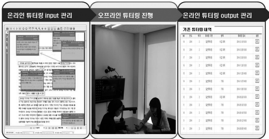
[그림] 글쓰기센터 튜터링 시스템 1

물론 튜터링을 통해 산출되는 이 모든 과정들은 센터의 웹 시스템에 저장됩니다. 그 결과, 학생들은 언제 어디서건 자신의 글쓰기 변화를 확인할 수 있으며, 그런 변화의 이력이 학생들의 훌륭한 포트폴리오로 활용되기도 합니다.