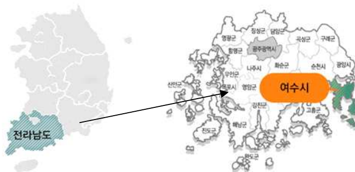
<그림1> 여수시 위치 (여수시청 홈페이지, 2019)

여수시 인구는 120,810세대에 외국인까지 포함하여 287,868명(2018. 12월 기준)이며 면적은 510.6 km 2 로 전라남도에서 가장 많은 인구가 거주하고 있는 지역이다 (여수시청 홈페이지, 2019).