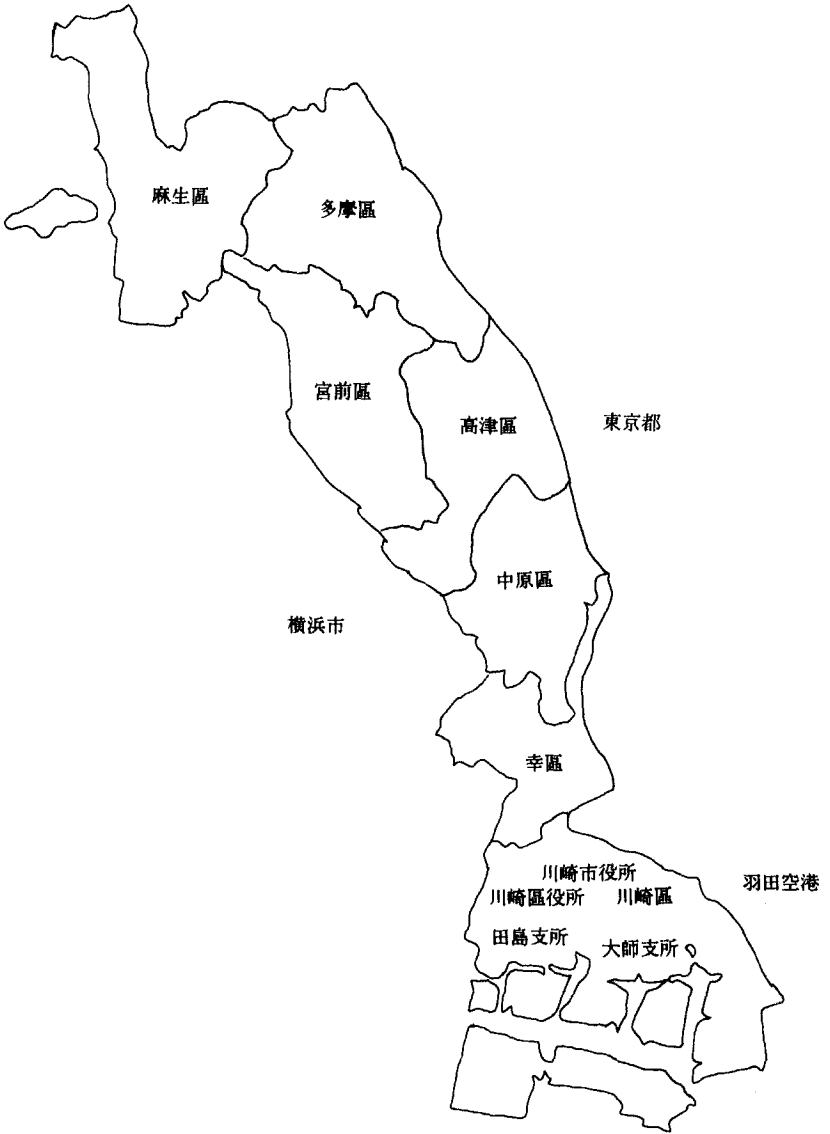
자료: 川崎市「區政概要」平成 4年度版