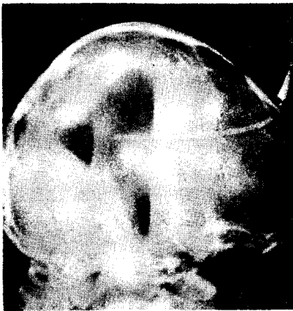
Fig. 2. Ventriculogram showing marked enlargement of lateral ventricle.

뇌실활영소견은 양측 측뇌실(both lateral ventricles)의 현저한 확장을 보여 주었고 양측이 대칭이었다.(제2도)