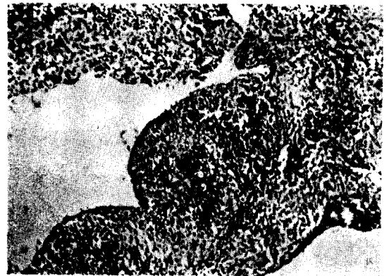
Fig. 3. Section of meninges showing numerous infiltration of plasma cells, lymphocytes and polymorphonuclear leucocytes. H & E staining, 100X.

병리조직소견 : 회백색 또는 황색의 괴사된 연결체조직이 육안적으로 보이며 현미경소견으로 혈관조직을 많이 포함한 연결체조직을 보이며 만성 또는 급성화농성 병변이 혼재하였고 원형세포, 임파구, 다형핵백혈구의