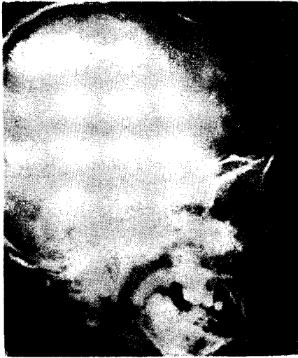
Fig. 1. Simple skull, lateral view showing the suture separation, and digital marking suggesting marked increased intracranial pressure.