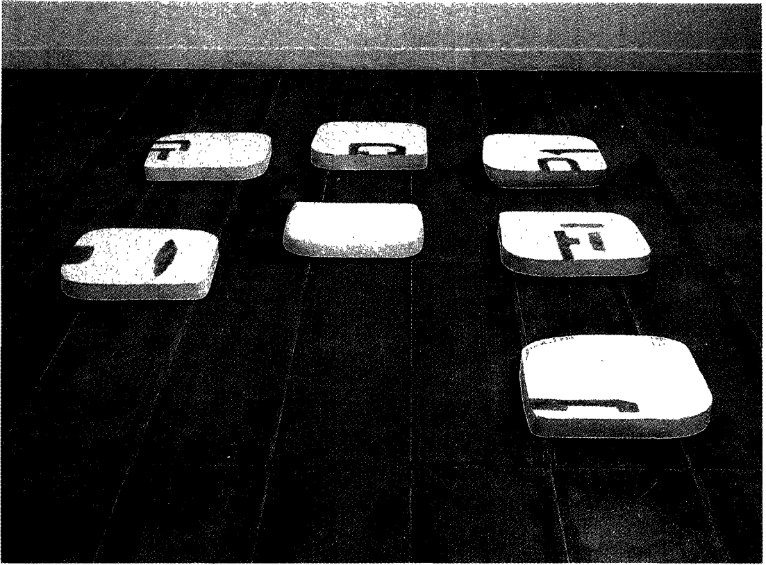
시간의 춤. 석고 230×230×9cm 1991 최인수 작