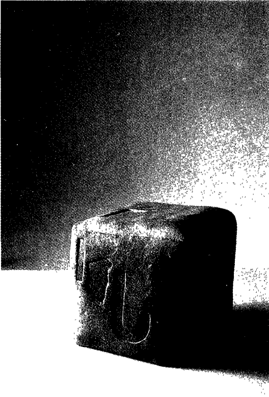
시간의 축(청동). 22×20×20cm 최인수 작