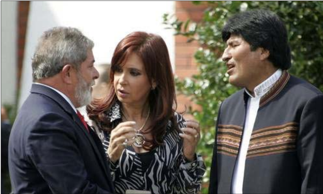
가스정상회담에 참석한 브라질, 아르헨티나, 볼리비아 정상들. 왼쪽으로부터 브라질 룰라 대통령, 아르헨티나 크리스티나 페르난데스 대통령, 볼리비아의 에보 모랄레스 대통령

가 1일 4,600만 입방미터에 달하지만 현재 볼리비아의 1일 생산량은 4,000만 입방미터 정도에 불과하다.