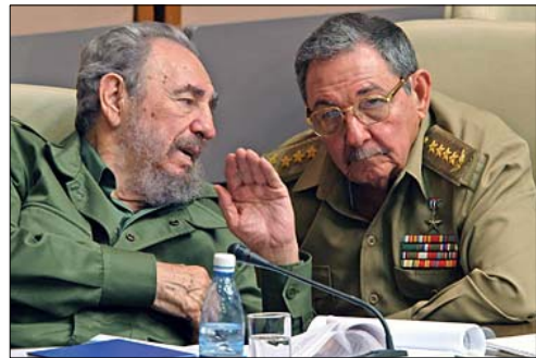
피델 카스트로와 라울 카스트로

피델 카스트로는 2월 19일 기관지 《그란마 Granma》 온라인판에 발표한 공개서한을 통해 국가평의회 의장 및 총사령관직에서 사임할 것을 밝혔다. 2006년 7월 이후 내장 질환 때문에 동생인 라울 카스