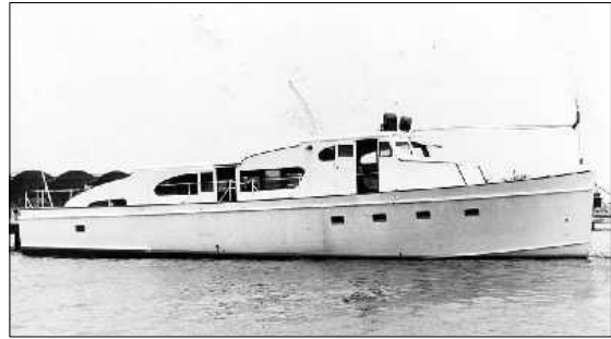
1956년 11월 25일 자정 카스트로와 체 게바라 등 82명을 태우고 쿠바로 떠난 〈그란마 호〉.

말대로 체 게바라는 분명 시인이었다. 하지만 〈모터사이클 다이어리〉는 그 전투적 시인의 삶을 낭만적인 서정시 운율에 옮겨놓은 뿐 서사시적 층위를 펼쳐 보이는 데는 치밀하게 무관심했다. 그리하여 〈소이 쿠바〉에서 시커먼 설탕눈물을