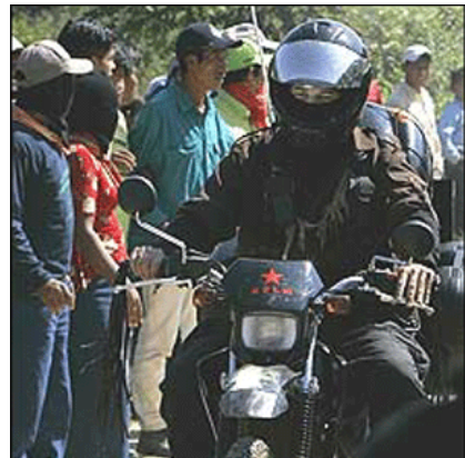
2006년 1월 1일 모터사이클 솜브라루스(‘빛과 그림자’라는 뜻)를 타고 전국일주에 나선 마르코스 부사령관

우선, 영화 <모터사이클 다이어리>는 전형적인 로드무비다. 로드무비는 “녹슬지 않는 창을 가슴에 지닌 채”, “구두굽 밑에서 로시난테의 박차”를 느끼며 20세기의 모험을 위해 대장정에 오른 체 게바라에게는 검정색 베레모처럼 딱 맞는 장르다. 푸세르(럭비 선수시절 친구들이 게바라에게 붙여준 별명)가 체로 변모해가는 여정을 정갈하게 편집한 <모터사이클 다이어리>는 그 자체로 길이 남을 하나의 이정표