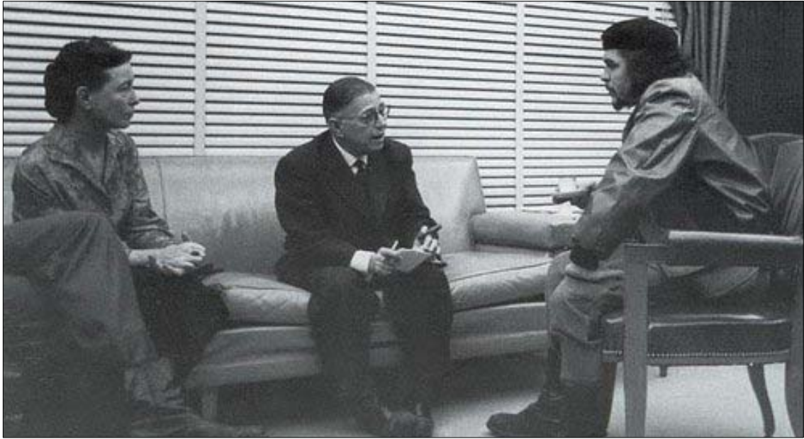
1960년 쿠바에서 체와 대담하고 있는 사르트르와 보바르. 사르트르는 체를 가리켜 “20세기의 가장 완전한 인간”이라고 평했다.

현실에 철저히 의거해 노동자뿐만 아니라 농민을 주력부대로 한 창조적인 인도아메리카 사회주의 건설을 주창했던 민족주의적 마르크스주의자인 호세 카를로스 마리아테기의 유명한 『페루의 현실에 대한 7가지 해석』을 체 게바라가 탐독하는 장면에서 카메라의 시선이 비교적 오랫동안 서성이게 했다. 하지만, 그뿐이다. 우리가 월터 살레스에게, 체 게바라에 기대하는 것은 이런 차원이 아니다. 탈정치화된 문장과 상징으로 구축되는 영화언어는 아니었다. 체 게바라 정신을 역사적 문맥과 정치적 문법으로부터 탈구시켜 선택적으로 나열하거나 선별해서 영화 공간에 이식시키는 그런 식의 ‘편집’과 ‘컷’의 미학을 기대하지는 않았다.