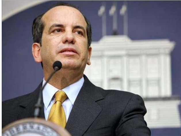
푸에르토리코의 주지사 아니발 아세베도

탈식민특별 위원회에 참석한 푸에르토리코 주지사 아니발 아세베도 빌라는 “미국 특히 부시행정부가 주민의 동의 없이 권력을 행사함으로써 민주주의를 해치고 있다”고 말하면서 이 문제를 유엔총회 결의에 붙여야 한다고 주장했다. 푸에르토리코는 1898년부터 미국의 실질적인 지배를 받아왔으며, 1952년에는 국방·외교·통화를 제외한 내정을 이양받아 미국의 자치령이 됐다. 1967년 이래, 완전한 독립과 미국편입을 두고 3차례 국민투표를 실시했으나 국민들은 현상유지를 선택했다.