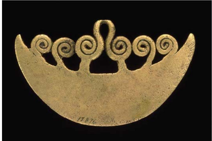
빙햄이 무단 반출하여 예일대학교 박물관에 소장된 마추픽추 유물. 예일대학교는 유물을 반환을 약속했다.