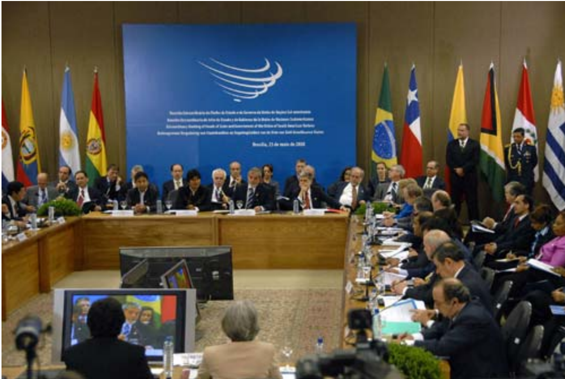
남미 12개국 정상들이 남미국가연합 협정에 서명하고 있다.

수리남, 우루과이, 베네수엘라이다. 이번 정상회담에서는 에콰도르 수도 키토에 상설사무국을 개설하고 고위급 협의기구와 외무장관 협의회, 정부대표 협의회 등 집행기구를 설치하기로 합의했다. 또 매년 한 차례 정상회의를 개최하고, 연 2회 외무장관 회담을 열기로 했다.