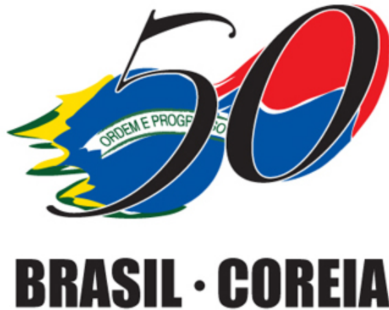
한-브 수교 50주년 기념 엠블럼