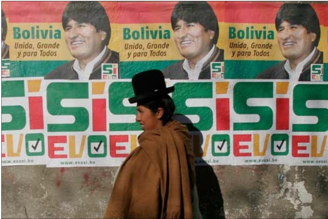
2008년 8월 10일 정부통령과 주지사 신임투표를 알리는 선거벽보. 이 신임투표에서 에보 모랄레스는 67.43%의 지지를 얻었다.

모니를 상실하지는 않았다. 또한 당시 지금보다도 훨씬 전통적인 분위기였던 추키사카 주에서 42%로 승리를 거두었고, 근소한 차이기는 하지만 산타크루스 주에서도 37%로 승리했다. 결국 1951년의 신화적인 선거는 —비록 좌파의 명백한 승리였지만— 사회주의운동의 승리보다 덜 압도적인 것이었다. 더 명확히 말하자면 1951년의 승리는 지금보다 훨씬 더 ‘서부의 승리’인 셈이었다.