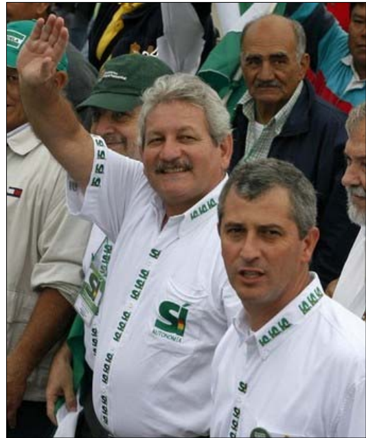
산타크루스 주지사 루벤 코스타스(가운데)와 열성적인 자치운동가 브란코 마린코빅. 이들은 2008년 에보 모랄레스의 헌법 개정 반대하여 산타크루스 주 자치운동을 전개했다.

자치를 원하는 산타크루스의 정서는 어찌 보면 고원지대의 집에서, 즉 고원지대의 빈곤과 주민과 이데올로기적·정치적 전통에서 자유로워질 필요성을 반영하고 있다. 자치안은 탈중앙집권주의 주장 이상의 무엇이다. 즉, 보통 서부 비전의 산물인 사회와 정반대의 사회를 만들고자 하는 것이다. 따라서 부의 창출을 신성시하는 —부의 창출 과정에서 야기될지도 모를 환경 문제나 사회 문제를 거의 무시하는— 사회, 외국인투자를 대대적으로 지지