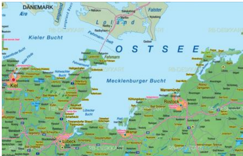
Lankarte von der Ostseeküste

Das gesamte Werk besteht aus insgesamt 37 Abschnitten bzw. Episoden, die jeweils unterschiedlich ausführlich gehalten werden. Jede Episode enthält einen Titel,