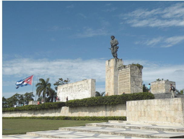
산타 클라라 광장의 체 게바라 기념비

국민에게 쿠바는 헤밍웨이의 섬이자, 마이애미에 정착한 ‘리틀 쿠바노’의 고향이기도 하다. 쿠바의 중부 도시 산타 클라라 광장에 우뚝 서 있는 체 게바라 기념비를 굳이 찾아가는 관광객을 순례자라고 부르는 미국인의 시선은 때로는 냉소적이기까지 하다. 필자가 거리에