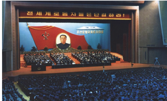
1980년 북한의 제6차 당대회

대 초반 중소 논쟁 과정에서 중국의 입장을 지지하던 북한은 경제 위기에도 불구하고 국방력 강화를 선언할 수밖에 없었다. 쿠바 사태가 10월 28일 끝난 불과 2개월 후 중앙위원회에서 북한은 경제·국방 병진 노선을 공식적으로 선언한 것이다. 소련