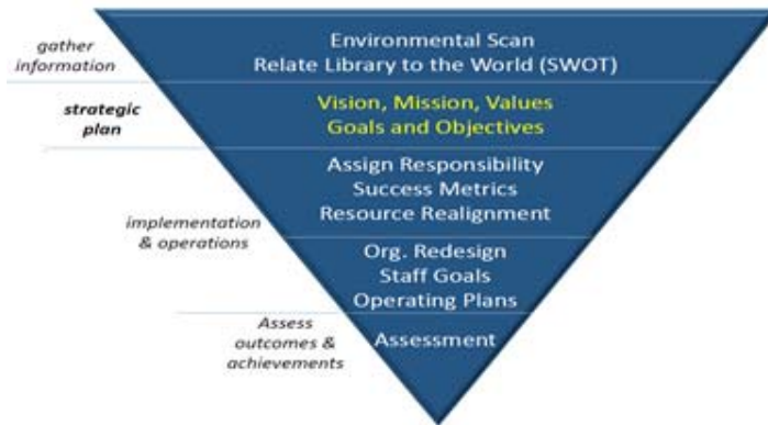
[그림 3] 실행계획 도출 프로세스

마지막 세션 6에서는 그동안 각 세션에서 다룬 교육 내용과 과제를 종합하여 각 팀별 토의를 통해 도출한 공동의 문제를 설정하고 이를 해결하기 위한 실행과제를 도출한 후 이를 발표하는 시간을 가졌다.