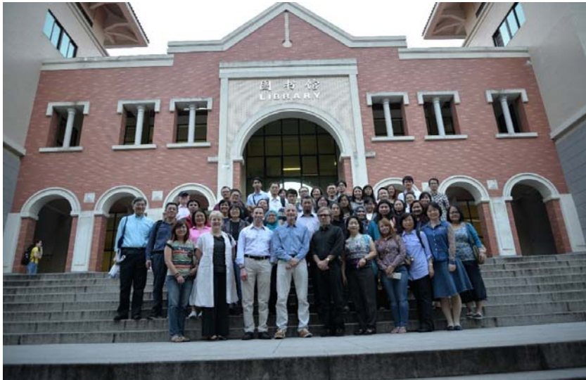
[그림 4] Leadership Institute 단체 사진

이번 교육은 비록 아시아권으로 한정되어 있지만 서로 다른 언어, 문화, 경제 등 다양한 환경에서 다양한 가치관을 갖고 있는 사람들이 ‘도서관’이라는 주제로 서로 모여 이야기를 나누고 정보를 교환하는 뜻 깊은 시간이었다.