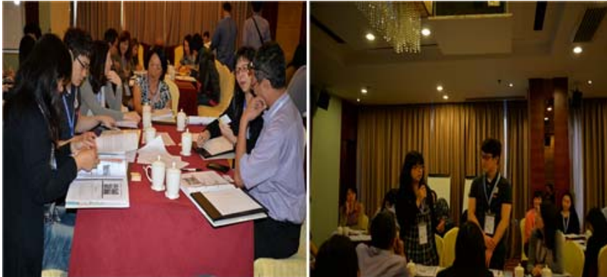
[그림 2] Annual Library Leadership Institute 활동 사진

1950~70년대 이후에는 정리업무 등의 비용분석, 계량분석, 시스템분석, 질적연구 등의 방법론이 적용된 경영관리 기법에 대해 활발한 연구가 이루어지고 있다고 설명하였다.