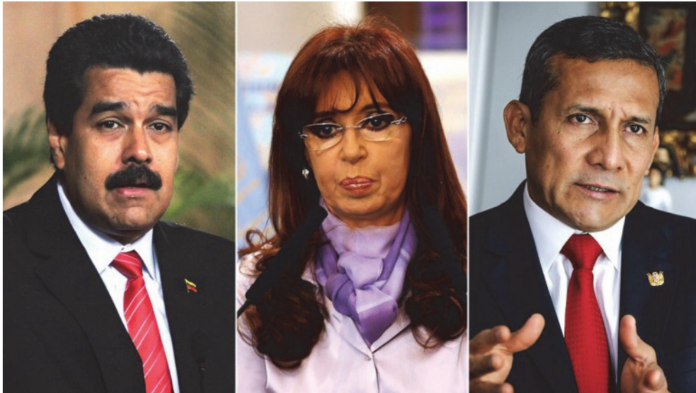
왼쪽부터 베네수엘라의 마두로 대통령, 아르헨티나의 키르치네르 전 대통령, 페루의 우말라 전 대통령

차가 진행되고 있다. 한때 80%대였던 칠레 사회당 바첼레트 대통령에 대한 지지율도 최근 20%대 초반까지 떨어졌다.