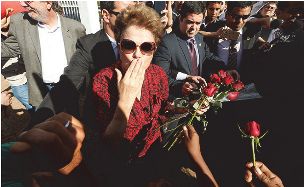
대통령 관저를 떠나는 호세프 대통령. 2016년 8월 31일 지우마 호세프 대통령에 대한 탄핵안이 상원에서 가결되었다.

시킬 수 있는 것이어야 한다. 원자재 수출 의존경제에서 탈피해 자원의 부가가치를 높일 수 있는 새로운 생산 모델의 실현 가능성을 보여주어야 한다. 또 필요한 세계개혁도 이루어낼 수 있어야 한다. 원자재 붐이 끝난 시점에서 더 이상 그의 수입만으로 사회적 서비스를 유지할 수는 없다. 따라서 사회적 불평등을 해소할 수 있는 실질적 세계개혁안을 제시해야 한다. 뿐만 아니라 그러한 안들을 다양한 반발에도 불구하고 민주적 절차에 따라 실제 정책에 적용할 수 있는 협상력과 실천력을 키울 필요가 있다. 마지막으로 민주주의의 틀을 끝까지 고수해야 한다. 그리고 민주적 제도 안에서 사회적 논리 사고의 틀을 쟁취하는 헤게모니 투쟁을 통해 재집권을 시도해야 할 것이다.