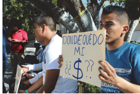
니니족의 시위 - “어디서 돈을 벌죠?”

라틴아메리카가 니니족의 문제를 해결하는 데 집중하지 않는다면, 경제 회복은 예상보다 어려울 수 있다.